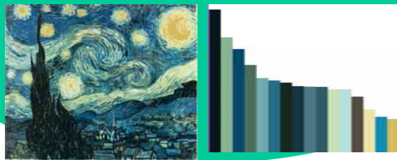
Van Gogh starring night 1888, NY MoMA