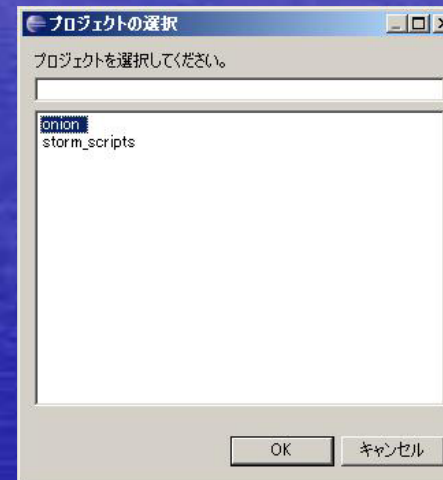
クラス名を一括変換するマクロ