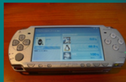
Tail Mobile on PSP

ユーザが飲み会や交流会に出かけて携帯端末(PSP)を開きテイルモバイルにアクセスすると、同じ場所に居る他のユーザとマッチングが行われます。画面上には自分が他のユーザとどのようなキーワード(テイル)でどの程度つながっているのが表示されます。