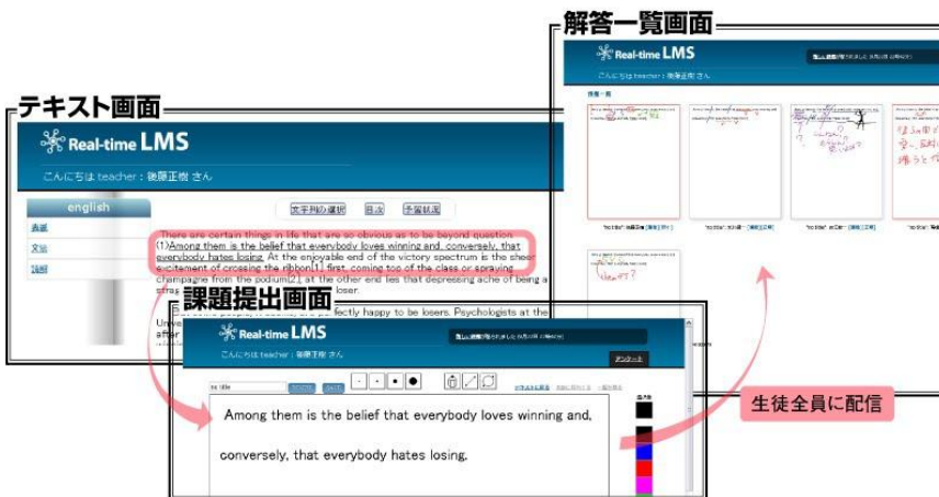
生徒の学習状況をリアルタイムで把握

ePub形式のデジタル教科書を本LMSにアップロードすると、ソーシャルリーディング機能、課題提出機能などをデジタル教科書自体に後付で組み込むことができ、双方向的な授業・協同学習を簡単に構築できます。