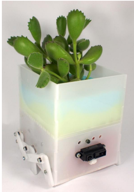
図 2. 6 足式 PotPet