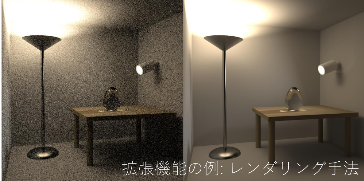
拡張機能の例: レンダリング手法