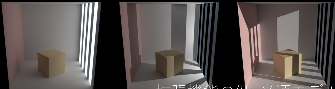
拡張機能の例: 光源モデル