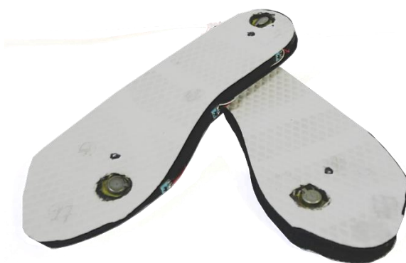
図 1 インソール型デバイス Vibsole

Vibsole は振動による情報提示と、慣性センサ、非接触スイッチを搭載したインソール型の「見なくていいインターフェース」である(図 1)。まず、振動モータを各足の前後 2 か所に搭載し、2 次元的な情報伝達を装着者に対して行う。また、装着者は足の動きと、左右の靴どうしを接触させることで生じる、Vibsole の内足側に取り付けられた磁石およびホール IC の近接によって、情報の発信を行うことができる。