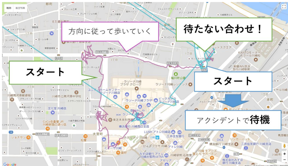
図 4 2 被験者による「待たない合わせ」テストの軌跡

本アプリケーションについて、2被験者(20歳前後・男性)によるテストをJR川崎駅周辺で行った(図 4)。同一地点から10分間異なる方向に向かって歩いた後に、Vibsoleが振動によって示す方向に向かって合流するまで歩いた。