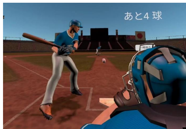
図 1. バーチャル世界におけるユーザの視界

システムは大きく分けてテストモードとトレーニングモードに分かれており、どちらも球審の実際の視界を体験する(図 1)。テストモードでは実際の試合と同様、ユーザは一定時間ごとに自動で投じられる球に対し、どのような球が投じられるかを知ることなくジャッジを下す仕様になっている。また、指定投球数を終えることでユーザの誤審率を提示する。トレーニングモードでは一球ごとに正解のジャッジを表示し、また様々な情報提示機能により効果的なトレーニングを行えるようになっている。