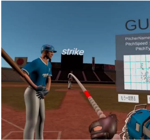
図 5. 軌道の可視化