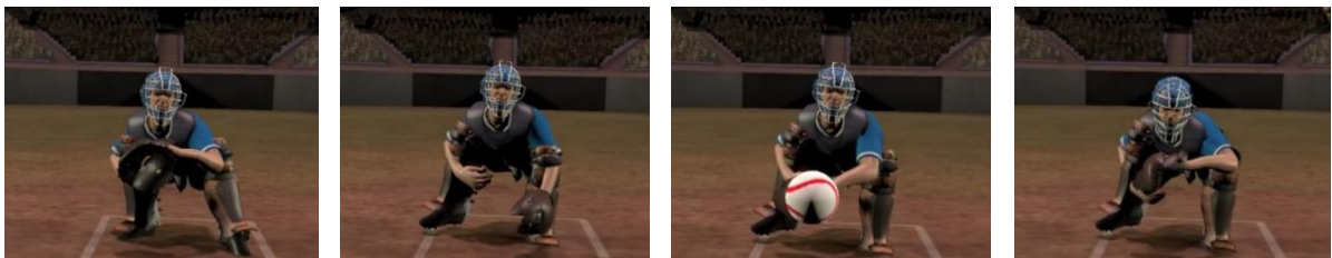
図 3. 作成した捕手のフレーミング動作

StrikeCall では効果的なトレーニングを実現するために、実世界で球審のジャッジに影響を与える要素である「捕手の捕球動作」をリアルに再現している(図3)。モーションキャプチャを用いて基本的な捕手の姿勢や動作を取得し、手作業で細かな修正を加えることで自然な動作を再現した。さらに、アプリケーションの中で投げられるあらゆる投球に対して自動で最適なフレーミング動作が再生されるように、投球の到達位置と捕手の位置からフレーミング動作を算出する方法を確立している。このため、あらゆる軌道に対して巧みなフレーミング動作が再生されるようになっており、ユーザはそのような影響の中でも正確なジャッジを下すためのトレーニングが行えるようになっている。