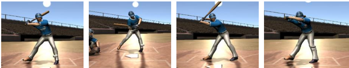
図 2. 作成した打者の動作

StrikeCall では効果的なトレーニングを実現するために、実世界で球審のジャッジに影響を与える要素である「打者の動作」をリアルに再現している。モーションキャプチャを用いて11種類の打者のモーションを取得し、それぞれに対して手作業による細かい修正を加えることでリアルなモーションを再現した(図2)。