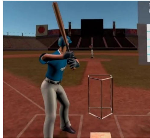
図 6. ゾーンの可視化