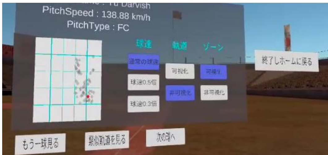
図 4. 投球情報の提示