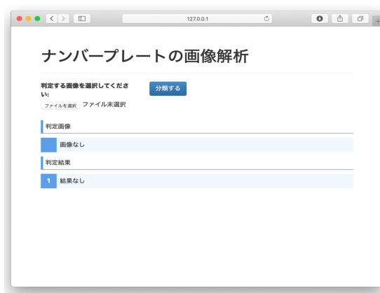
図 2 : ナンバープレート画像の解析を行う Web アプリケーション

QBoost と NBMF で学習済みモデルを保存したデータを用いて、ナンバープレート画像を二段階で解析する。図 2 のような実行画面から、ファイルを選択し、「分類する」というボタンを押すと、ナンバープレート画像から自動で最大 4 桁のナンバー部分を検出し、図 3 のような流れで二段階の画像解析が行われる。