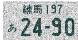
図 4 : ナンバープレート画像の例

はじめに、QBoost の学習アプリケーションで保存した分類器を用いて、数字の分類を行う。全ての数字を解析できた場合は、第一段階で処理を終了する。ここで正しく分類できなかった数字が存在した場合は第二段階の NBMF に引き継ぎ、保存した学習行列を用いて種類を推定する。例えば、図 4 のようなインパルスノイズがかかっている画像を解析した結果を紹介する。