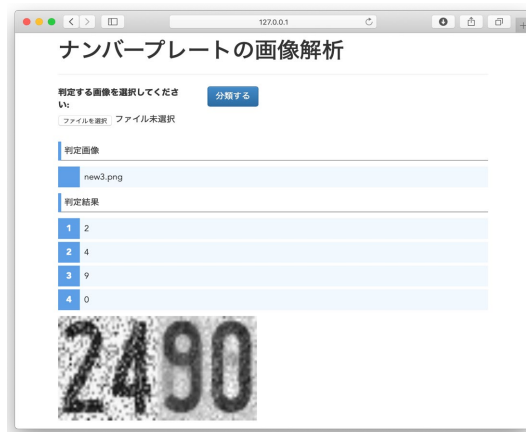
図 5 : Web アプリケーションの解析結果例

解析が終わると、図 5 のように解析結果が表示される。左 2 桁の数字は第一段階で分類できたもので、元の画像をそのまま表示している。右の 2 桁は第二段階へ引き継がれたもので、NBMF の特徴行列を利用して作られた再現画像を表示している。これによって、どのような特徴を選択して解析を行ったかを可視化している。ノイズがのっている画像に対しても解析に成功していることが確認できた。