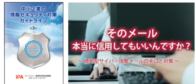
中小企業の情報セキュリティ対策ガイドライン

IPAの情報セキュリティ対策コンテンツを「知りたい」「学びたい」「始めたい」「強化したい」の4つのレベルに分類してご案内します。 あなたの会社のセキュリティ課題や、求める対策レベルに合った各種資料・ツールを簡単に探すことができます。